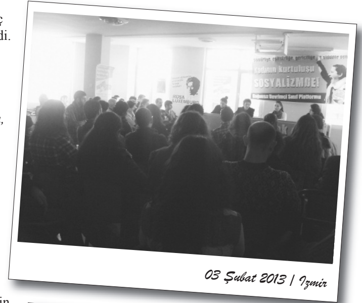
03 Şubat 2013 | İzmir

Yapılan sunumda kadın sorununun çıkışına değinilerek, tarihsel diyalektik materyalizmin ışığında