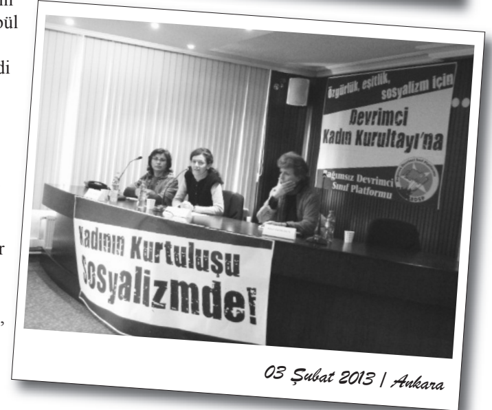
03 Şubat 2013 | Ankara

konunun ele alınması gerektiğine vurgu yapıldı. Kadın sorununun özel mülkiyetin çıkışıyla ortaya çıktığına vurgu yapılarak, öncesi dönemlerde kadının cins olarak ezilmesinin olmadığı bilimsel araştırmalardan verilen örneklerle anlatıldı.