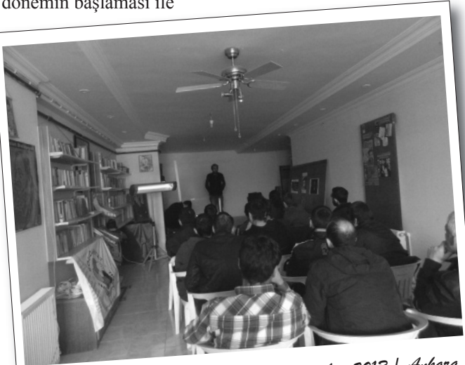
02 Şubat 2013 | Ankara