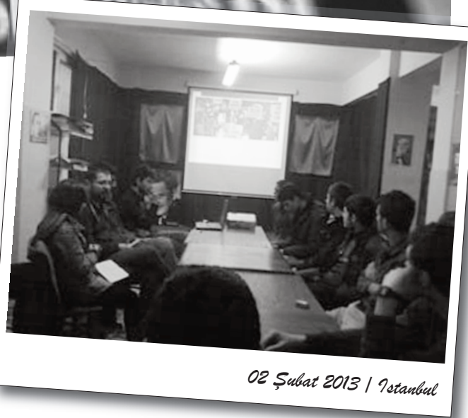
02 Şubat 2013 | İstanbul

Aranın ardından DLB'nin önümüzdeki dönem yürüteceği çalışmalar üzerine konuşuldu. Bu kapsamda yayın ve materyal kullanımı, yayına katkı, farklı araçların kullanılması, düzenli toplantılar ve etkinlik-eylem gerçekleştirilmesi gibi öneriler getirildi. Güncel bir deneyim olarak Esenyurt'ta gerçekleşen karne eylemi değerlendirildi. Ayrıca ikinci dönemin başlaması ile